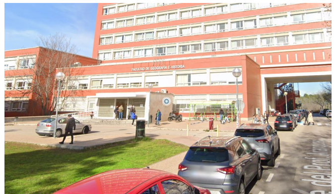
(b) Acceso a plantas 1, 2 y 3 (Geografía e Historia).

https://maps.app.goo.gl/MF81DYVJJTdvk8Zi8