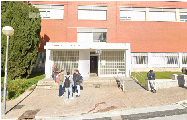
(a) Edificio planta sótano.

En la Figura 2 se muestran los accesos a la Facultad de Geografía e Historia, así como su ubicación de Google Maps . Como se puede ver, el PUNTO A de la Figura 1 corresponde al acceso Principal , desde el que se puede acceder a las plantas 1, 2 y 3, tal y como se muestra en la Figura 2b . Por extensión, el PUNTO B , reseñado en la Figura 1 , corresponde al acceso directo a la planta sótano, mostrado en la Figura 2a .