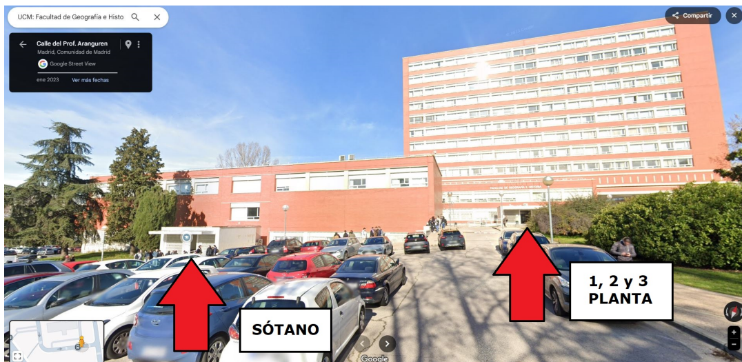
Figura 3: Vista frontal entradas

Para mayor aclaración, en la Figura 3 se muestra una vista de las entradas indicadas anteriormente.